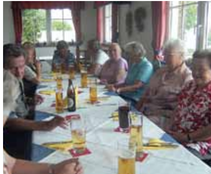
Beim Bratlessen ...

Dann noch der Ausflug zur Edelweißhütte nach Wagrain. Die Besichtigung der Firma Adlerin Ansfelden mit einer wunderschönen Schifffahrt auf der Donau bis Schlögen. Von Jänner bis Juni regelmäßig Kegeln alle 14 Tage von 15 – 18 Uhr. Nach der Sommerpause geht es am