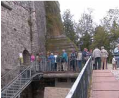
In den Abruzzo ...

Im Rahmen unseres Seniorenverbandes hatte das laufende Jahr schon viele Höhepunkte. Begonnen mit einem lustigen Faschingnachmittag mit Tanz und Musik im Februar, dann ein Bratlessen im Hotel Weiße Taube, wo von der Ortsgruppe Zell am Moos viele dabei waren. Die Muttertagsfeier war schon im April im Hotel Krone, da wir im Mai eine Woche mit Senioren-Reisen in den Abruzzo waren. Bei schönstem Wetter und vielen interessanten Ausflügen.